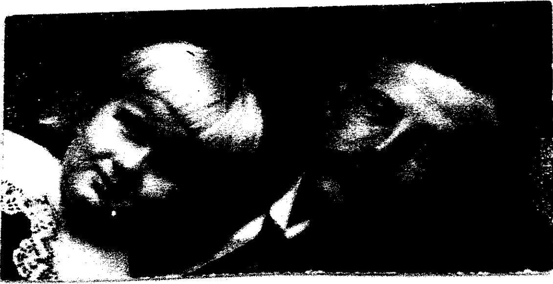
3. Arne och pappa Hjalmar