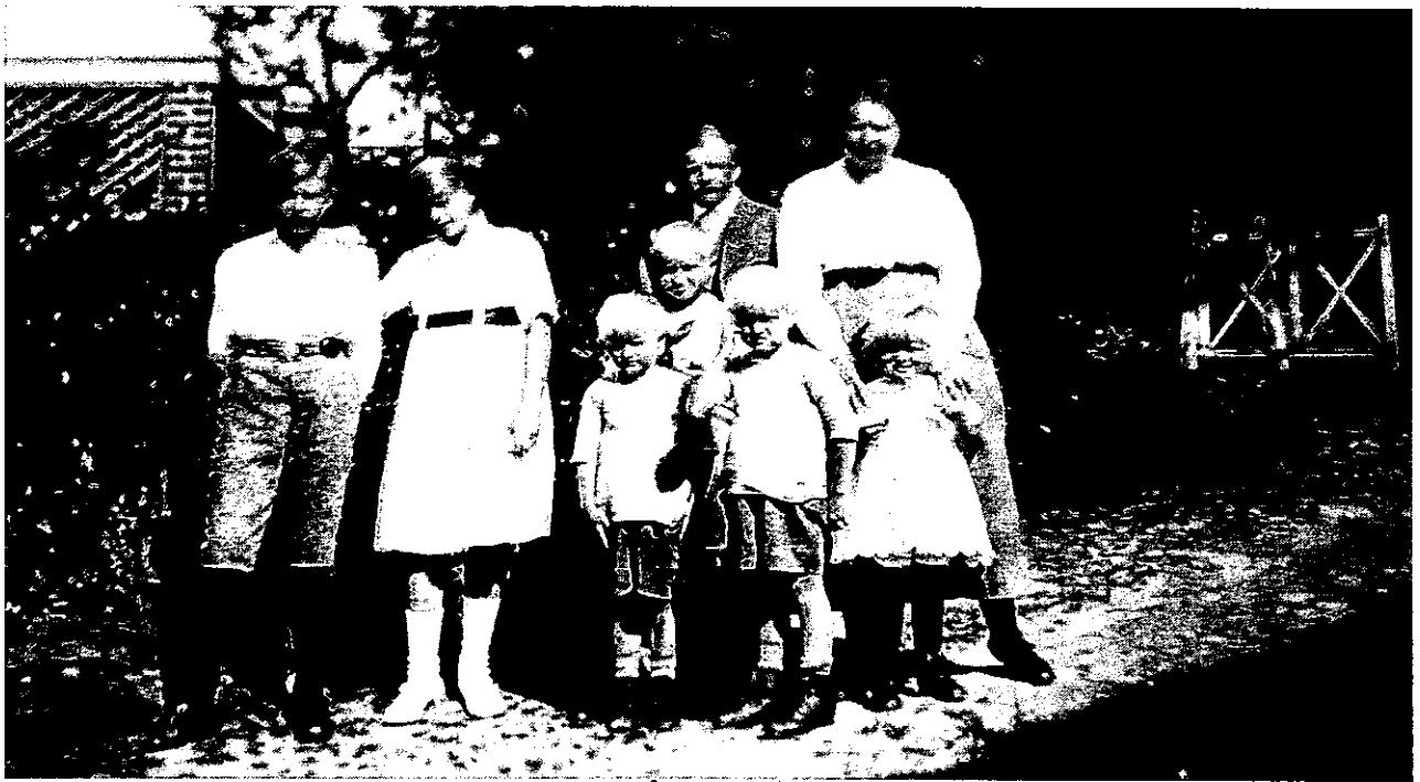
1. Två generationer